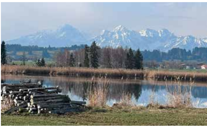
Blick über den Huttlerweiher