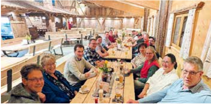
Gute Stimmung bei der Jahresversammlung des RGS in Stoagers Stube