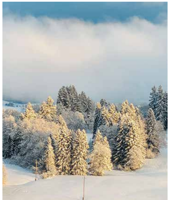
April - April, Abendsonne nach einem Schneetag