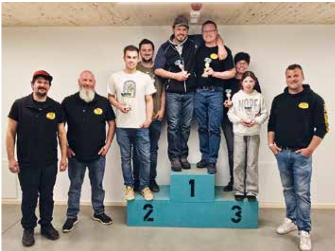
Die Sieger der Ostereiersuchfahrt.

Am Ostermontag dem 06. April fand unsere traditionelle Ostereiersuchfahrt bei sonnigem Wetter statt. Sie war wieder gut besucht, mit 47 Teams und bester Laune. Neben den Schildern mussten die Teams auch Stempel suchen und 5 Spiele absolvieren, um möglichst viele Punkte zu sammeln. Die Siegerehrung fand um ca. 18:30 Uhr in Stoager's Stube statt, wo sich auch jeder nach der erlebnisreichen Suchfahrt Stärken konnte.