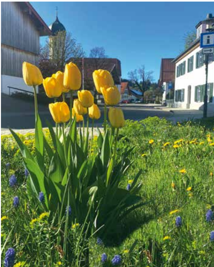
Blick auf die Kirche und Touristinformation mal aus einer anderen Perspektive