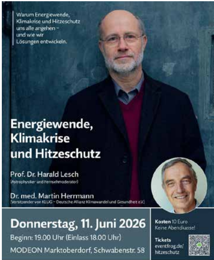
Plakat: Landratsamt Ostallgäu – Servicestelle Klima

Landratsamt Ostallgäu – Servicestelle Klima