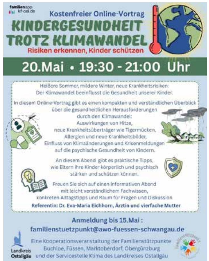
Plakat: Landratsamt Ostallgäu – Servicestelle Klima

und schützen können. Die Veranstaltung richtet sich an (Groß-)Eltern, Fachkräfte und Interessierte und wird in Kooperation mit den Familienstützpunkten im Ostallgäu in Marktoberdorf, Obergünzburg, Füssen und Buchloe angeboten. Der Vortrag findet am Mittwoch, 20. Mai 2026, von 19.30 bis 21 Uhr statt. Eine Anmeldung ist bis 15. Mai 2026 per E-Mail an familienstuetzpunkt@awo-fuessen-schwangau.de möglich.