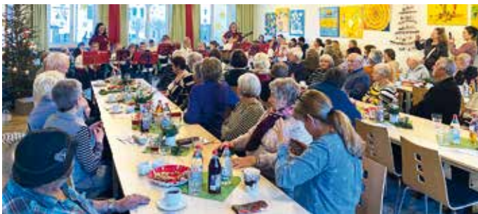
Buntes Programm bei der Weihnachtsfeier

Einmal im Monat traf man sich zum „Geselligen Mittagstisch“ und an Fasching und Weihnachten wurde zum bunten Programm mit Kaffee und Kuchen eingeladen.