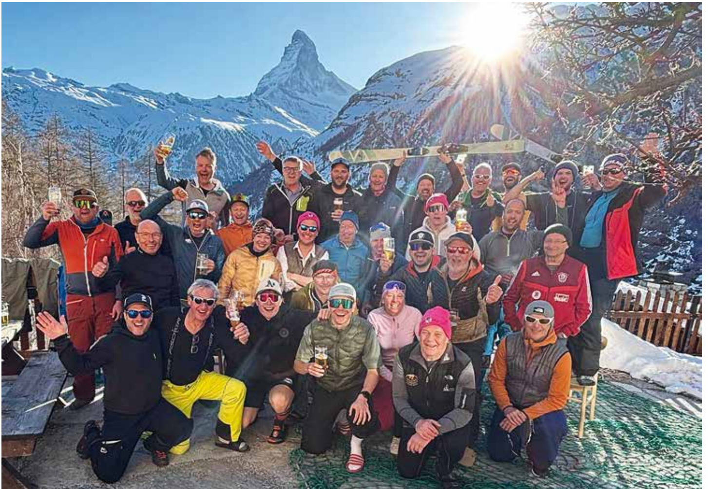
Bild: Robert Häusserer, alle Teilnehmer*innen beim Skiausflug nach Zermatt