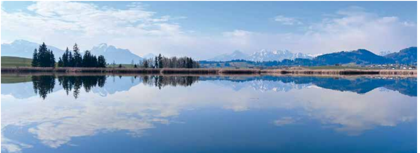
Blick über den Huttlerweiher