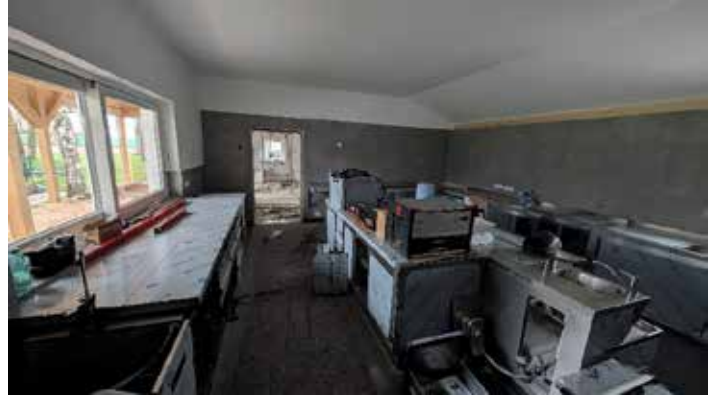
Bauimpressionen vom Wettekiosk...