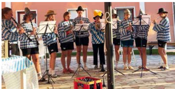
Die Musikerinnen geben ein Überraschungskonzert

Mitte März ging es für die Damen für ein langes Wochenende ins Trainingslager nach Lazise. Das Traumwetter bot die perfekte Grundlage für abwechslungsreiche Trainingseinheiten, stärkende Teambuilding-Aktivitäten bis hin zu einem Überraschungskonzert unserer Musikerinnen.